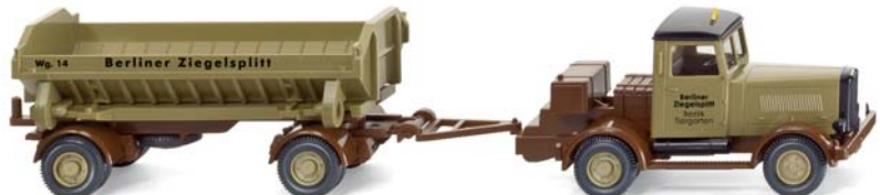
0850 49 Hanomag mit Muldenkipp-Anhänger

Auf dieses Spezialfahrzeug haben Modell-enthusiasten schon lange gewartet: WIKING stellt erstmals eine Hubrettungsbühne vor, die nach dem Metz Vorbild B32 mit hoher Investitionskraft in neue Formen als voll funktionsfähige Präzisionsminiatur konzipiert und 87-fach verkleinert wurde. Viele Details am Aufbau, aber vor allem der teleskopierbare Hubrettungskorb begeistern. In einmaliger Auslieferung erscheint überdies ein zeitgenössisches DKW-Themen-Set, das auf die Alltags-tauglichkeit des Universals und des Juniors als flinke Stadtlieferwagen zurückblickt. Pkw-Freunde finden mit