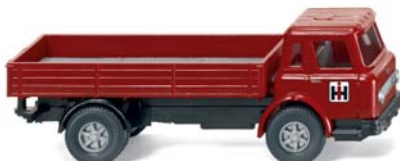
0446 01 Pritschen-Lkw (International Harvester)