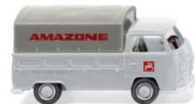
0316 02 VW T2 mit Plane