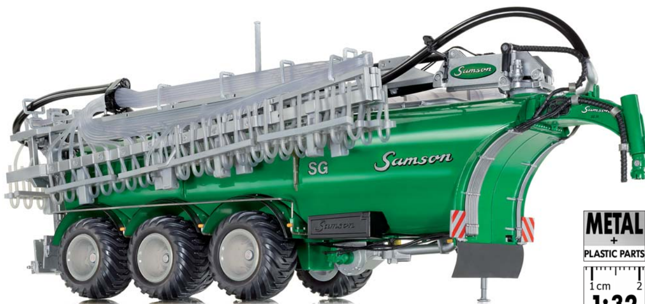
0773 11 Samson Fasswagen SG28

E s ist ein wirklicher Präzisionsmodell-Gigant: Mit dem Samson Güllewagen SG28 setzt WIKING neue Maßstäbe bei den Land-