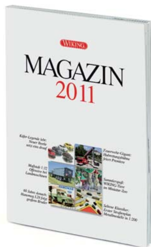
0006 18 WIKING Magazin 2011

W IKING erinnert an das Jubiläum der Markteinführung des legendären britischen Roadsters: 50 Jahre Jaguar E-Type – der zum Synonym für die stilvolle englische Sportwagentradition geworden ist. Außerdem kommt der filigrane Schlepper-Klassiker aus dem Hause Eicher zur Auslieferung. Der Königstiger vollzieht die nuancierte Farbaktualisierung der damaligen Traktorschmiede nach. Darüber hinaus gibt es ein Wiedersehen mit dem über vier Jahrzehnte alten Muldenkippl-Anhänger, für den WIKING die historischen Formen revitalisierte und damit zugleich ein Pendant zum vorbildgleichen Hanomag-Neuheitengespann bereitstellt. Der Unimog U20 und der