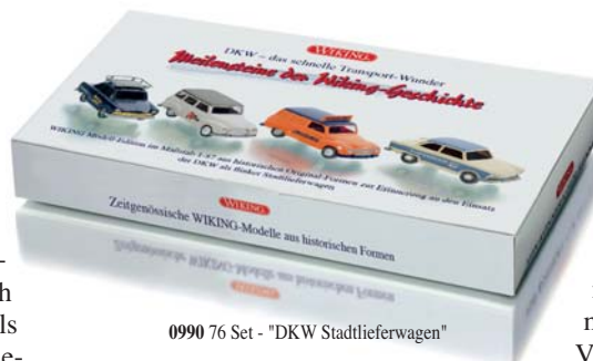
0990 76 Set - "DKW Stadtlieferwagen"

Auf dieses Spezialfahrzeug haben Modell-enthusiasten schon lange gewartet: WIKING stellt erstmals eine Hubrettungsbühne vor, die nach dem Metz Vorbild B32 mit hoher Investitionskraft in neue Formen als voll funktionsfähige Präzisionsminiatur konzipiert und 87-fach verkleinert wurde. Viele Details am Aufbau, aber vor allem der teleskopierbare Hubrettungskorb begeistern. In einmaliger Auslieferung erscheint überdies ein zeitgenössisches DKW-Themen-Set, das auf die Alltags-tauglichkeit des Universals und des Juniors als flinke Stadtlieferwagen zurückblickt. Pkw-Freunde finden mit