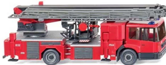
0628 49 Hubrettungsbühne Metz B32 (MB Econic)