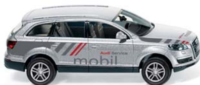
0133 05 Audi Q7