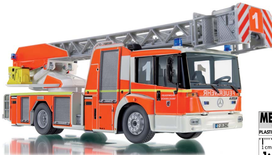
0431 02 Feuerwehr - DL 32 (MB Eonic)