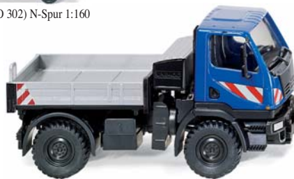
0369 02 Unimog U20