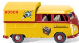
0789 03 VW T1 Doppelkabine mit Plane