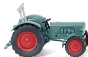
0871 41 Eicher Königstiger

W IKING erinnert an das Jubiläum der Markteinführung des legendären britischen Roadsters: 50 Jahre Jaguar E-Type – der zum Synonym für die stilvolle englische Sportwagentradition geworden ist. Außerdem kommt der filigrane Schlepper-Klassiker aus dem Hause Eicher zur Auslieferung. Der Königstiger vollzieht die nuancierte Farbaktualisierung der damaligen Traktorschmiede nach. Darüber hinaus gibt es ein Wiedersehen mit dem über vier Jahrzehnte alten Muldenkippl-Anhänger, für den WIKING die historischen Formen revitalisierte und damit zugleich ein Pendant zum vorbildgleichen Hanomag-Neuheitengespann bereitstellt. Der Unimog U20 und der