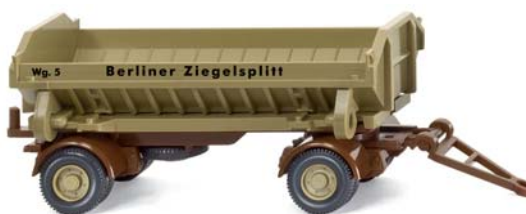
0675 49 Muldenkippl-Anhänger